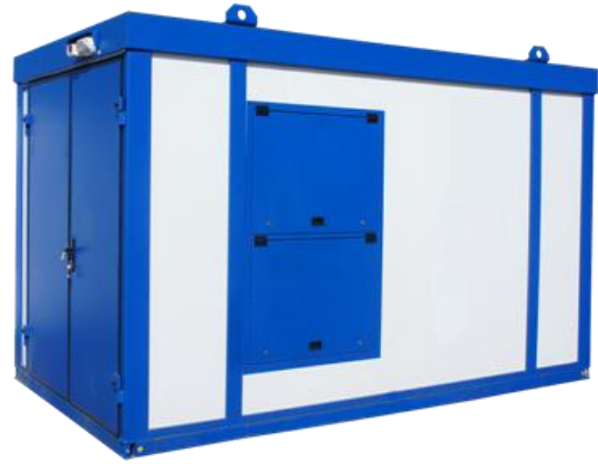
Дизельная электростанция в блок контейнере «Север»

Дизель-генераторные установки в зависимости от условий эксплуатации могут быть выполнены в следующих исполнениях: