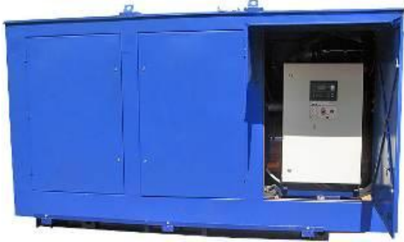
Дизель-генератор в погодозащитном капоте